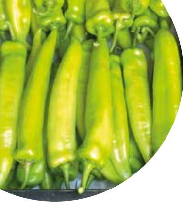
Astrapi F 1