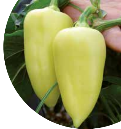
Adonis F 1