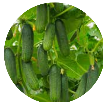
Apalosa F 1