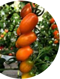
Odat F 1