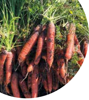
Orchestra F 1