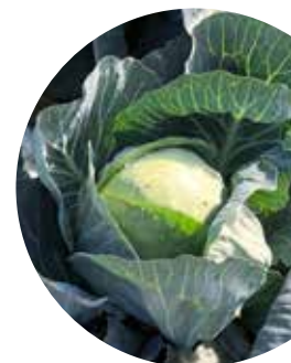
Albatros F 1