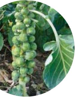
Brilliant F 1