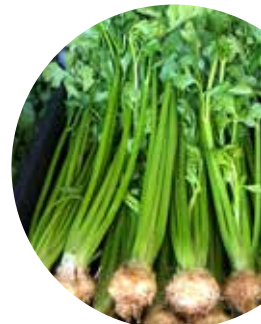
Monet F 1