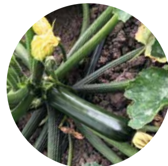
Esencia F 1