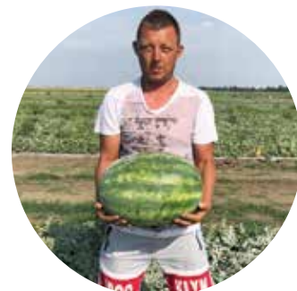
River Side F 1