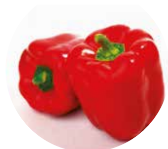
Predi F 1