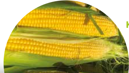
Kamet F 1