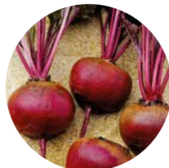
Camaro F 1