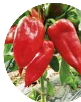
Keyten F 1