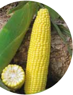
Rustler F 1