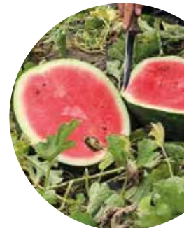
Aksent F 1