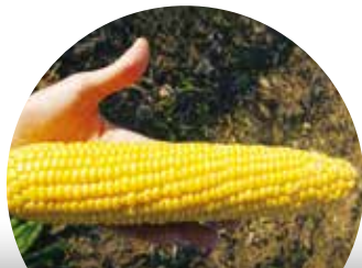
Kiara F 1