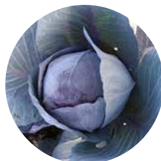
Kvit F 1