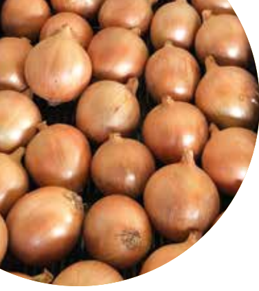
Armina F 1