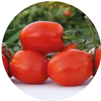
Vilaka F 1