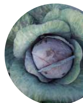
Moderat F 1