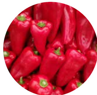
Feraro F 1