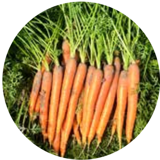
Flamenco F 1