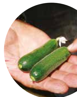
Cosima F 1