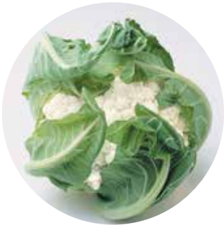
Locris F 1