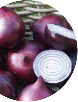
Magnate F 1