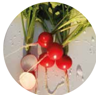
SX-718 F 1