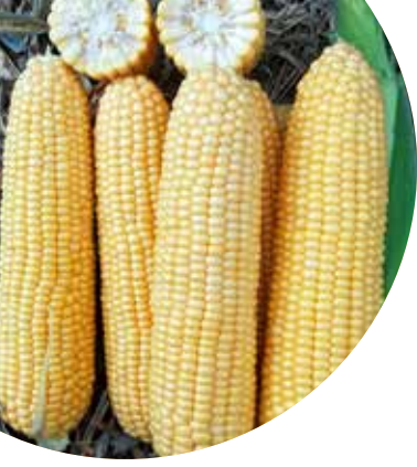
Ketama F 1