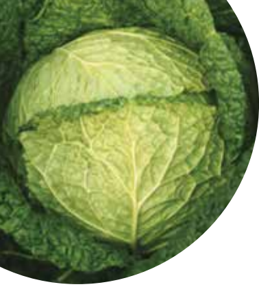
Verita F 1