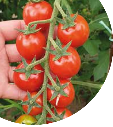
Prymello F 1