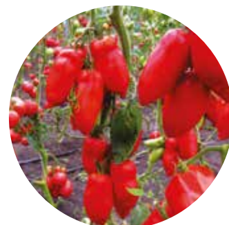
Cornabel F 1