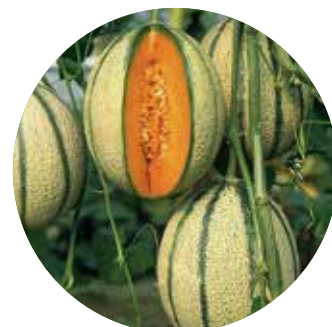
Pepito F 1