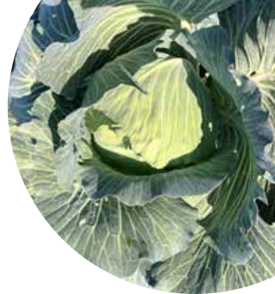
Kampe F 1