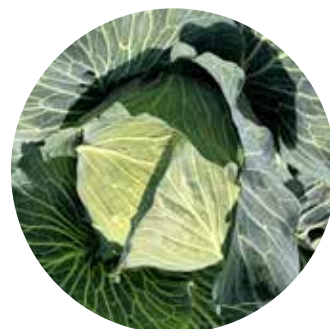
Madison F 1