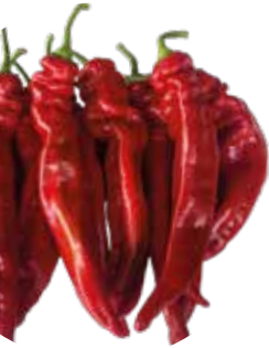
AL 701-17 F 1