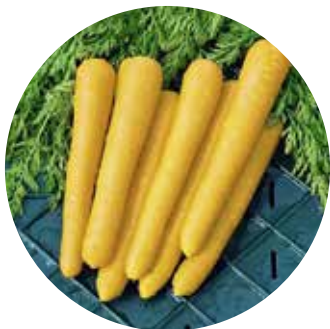
Gold Nugget F 1