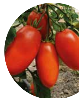
Sir Elyan F 1