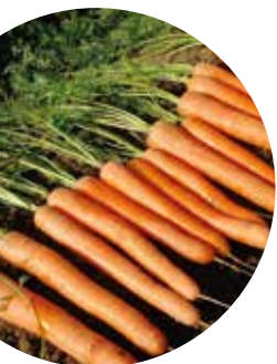
Octavo F 1