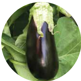
Paula F 1