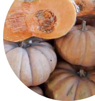
Musque de Provence