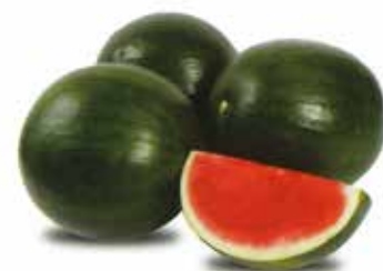
Bungi F 1