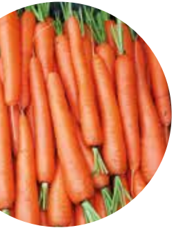
Soprano F 1